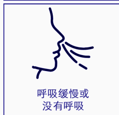
呼吸缓慢或 没有呼吸