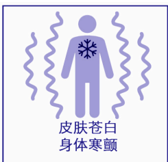
皮肤苍白 身体寒颤