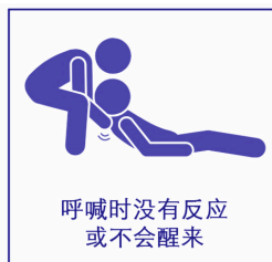
呼喊时没有反应 或不会醒来

患者最初会不停点头。随着时间推移，他们的呼吸会减慢或停止，而且不会醒来。检查是否有呼吸困难的迹象。