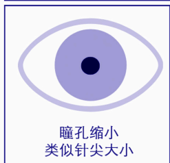
瞳孔缩小 类似针尖大小