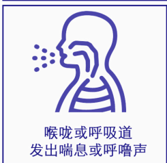
喉咙或呼吸道 发出喘息或呼噜声